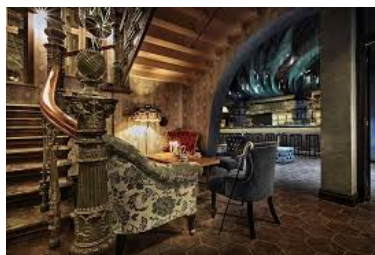
Stora hotellet och Väven